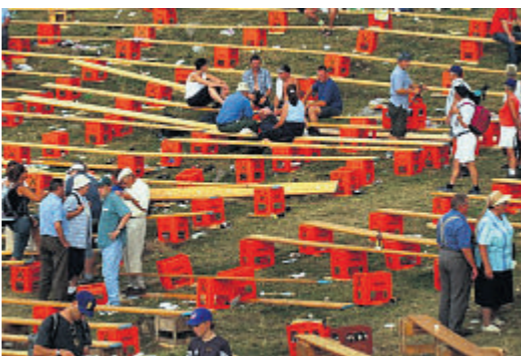
Improvisiert: Für die ersten Austragungen des Bergkranzfestes auf der Schwägälp Anfang der 2000er-Jahre wurde auf der Passhöhe aus ein paar Brettern und Getränkeharassen ein provisorisches Naturstadion errichtet.

1998 organisierte der Appenzeller Kantonalverband auf der Schwägälp den Kantonalen Schwingertag als Probeanlass für ein Bergschwinget. Der Wertkampf war ein voller Erfolg und bestätigte die Organisatoren in der Auffassung, dass die Schwägälp der richtige Ort für ein Bergschwinget in der Nordostschweiz ist. Im Herbst 1998 wurde der Antrag, alljährlich ein Bergschwinget mit Kranzabgabe auf der Schwägälp durchzuführen, an den NOSV zur Weiterleitung an den nationalen Verband (ESV) eingereicht. Der gleiche Antrag wurde auch vom Organisationskomitee Rickenschwinget mit Festort Ricken eingereicht. Somit mussten die Delegierten an der NOS-Delegiertenversammlung im Januar 1999 eine Standortbestimmung vornehmen. Das Resultat fiel deutlich auf den Festort Schwägälp. Noch aber war der Durchbruch nicht geschafft.