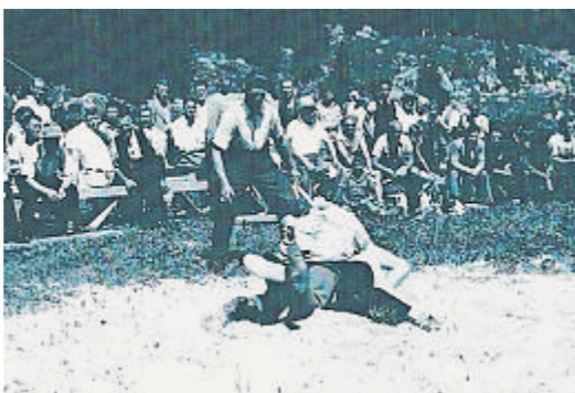
In den 1950er-Jahren waren die Zuschauer ebenso nahe am Geschehen wie heutzutage. Ein numerier- alper Sitzplatz kostete vier Franken, ein Stehplatz zwei Franken. Die Schwinger wurden angewiesen, «pünktlich und in sauberer Kleidung» anzutreten.

Ein Bergschwinget war im Appenzell schon 1920 ein Thema, als der Kantonalverband seine Selbständigkeit proklamierte. Ein Jahr später, im Jahr 1921, fand der erste Bergschwinget auf der Hochalp ob Urnäsch statt. Nach einer zweiten Austragung im Folgejahr trat eine längere Pause ein. 1927 gab es noch einen Kantonalen Schwingertag auf der Hochalp. Doch Ende der 1920er-Jahre verschwanden sowohl der Hochalp-Schwinget wie auch der Willisbad-Schwinget vom Kalender – im gesamten Nordostschweizerischen Verband (NOSV) fehlte somit ein Bergschwinget von Bedeutung. Anfang 1950 bewarb sich der Schwingclub Herisau für den Kantonalen Schwingertag mit Austragungsort Schwägälp. Der Gedanke eines Schwägälp-Schwingets war geboren. Und noch im gleichen Sommer fand bei schönstem Wetter der Kantonale Schwingertag statt.