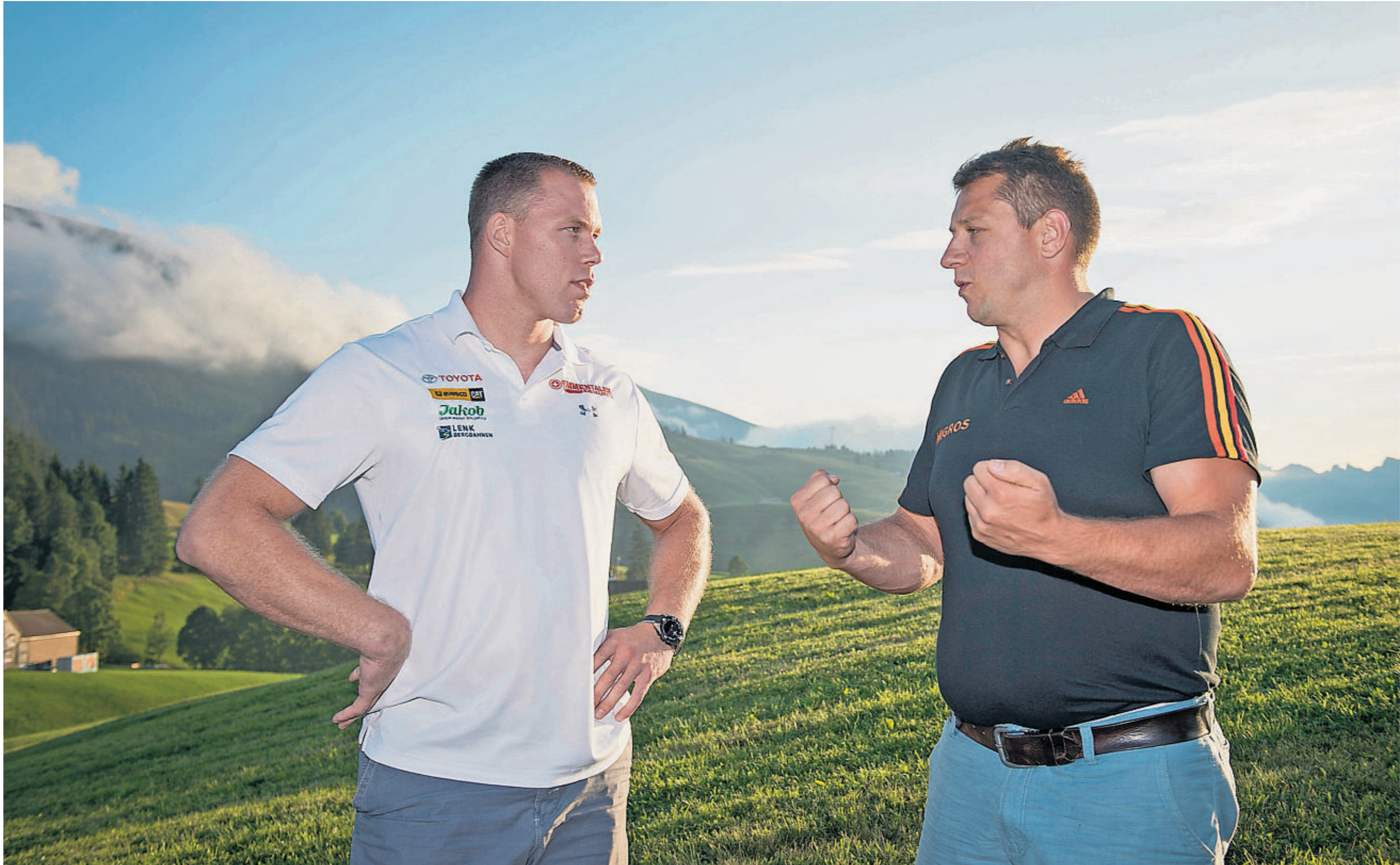
Könige unter sich: Im Hinblick auf den Schwägälp-Schwinget diskutieren der verletzte Matthias Sempach (links) und der zurückgetretene Jörg Abderhalden über die Entwicklung ihrer Sportart und erörtern, warum die Berner Gäste derzeit die Nase vorn haben.

Was fehlt den NOSV-Schwingern? Abderhalden: Es fehlt die Breite. Hätte Daniel Bösch ein starkes Team im Rücken, wäre er gefährlicher. Er ist mehr oder weniger auf sich gestellt. Bösch kann zwar gegen Stucki gewinnen. Danach steht aber meistens der nächste Berner da. Es sieht nicht danach aus, als würde sich daran in den nächsten zwei Jahren etwas ändern.